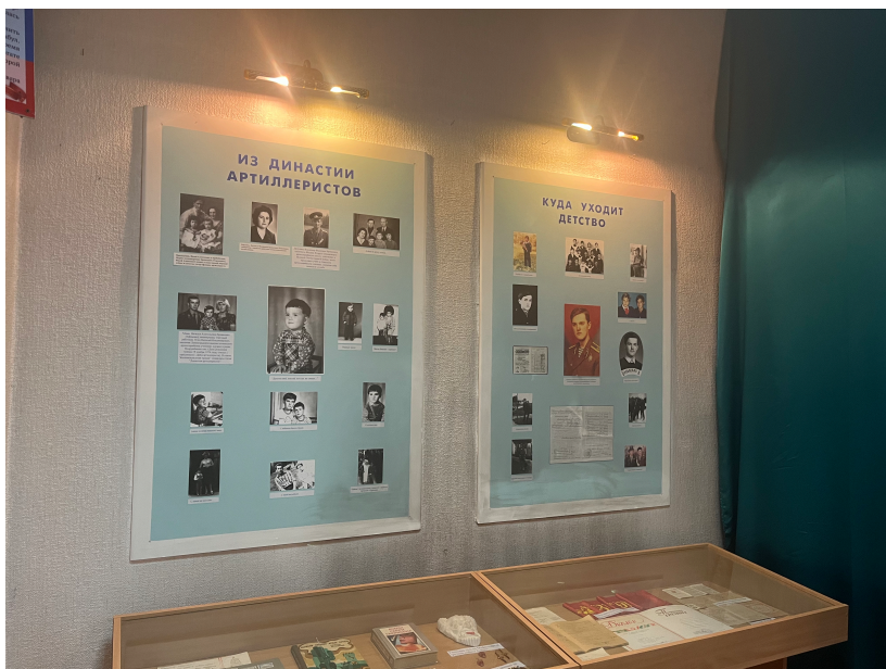
Фото на сегодняшний день

Территория проекта: помещение школьного музея с отдельным входом, S = 16 \text{ м}^2 .