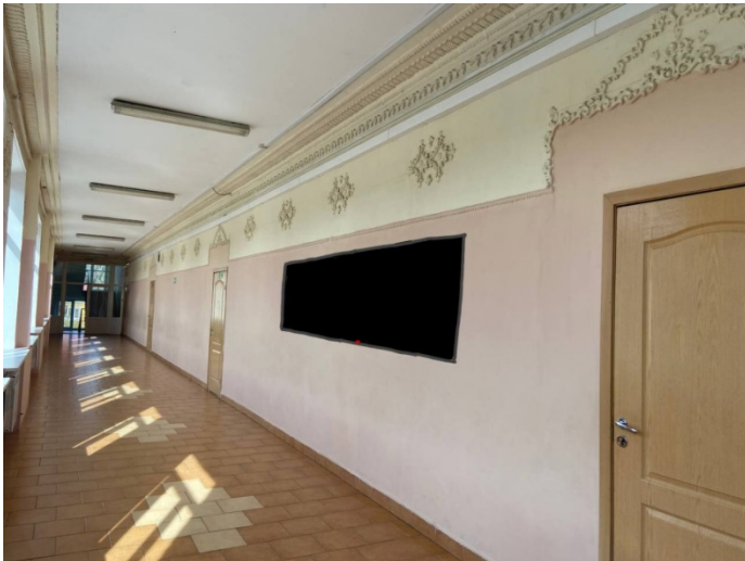
Фото на сегодняшний день

Территория проекта: Цокольный этаж школы (площадь - кв.м), коридор третьего этажа школы (144 кв.м).