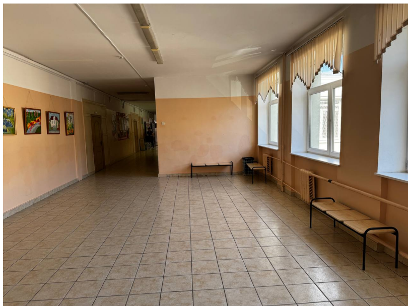
Фото на сегодняшний день