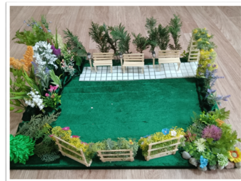
Примерный макет изменений

При входе в аллею будет установлена арка, оплетенная вьющимися цветущими лианами. Данная территория имеет размер 28м x 16 м, расположена слева от входа в школу.