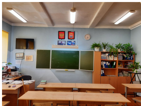
Фото на сегодняшний день

Территория проекта: кабинет № 39 на втором этаже школы (S-36 кв.м) и рекреация около него.