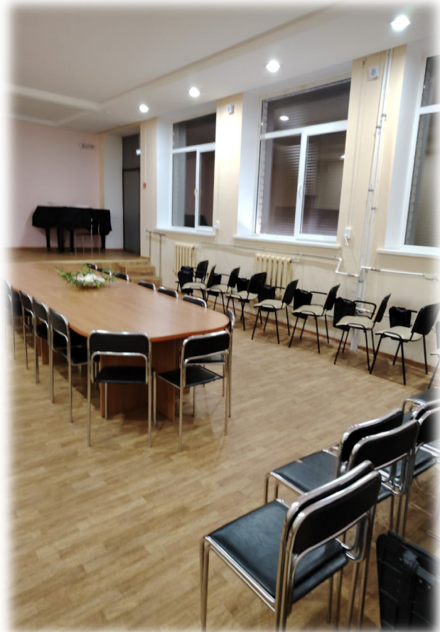
Фото на сегодняшний день

Цель –создать комфортное пространство с необходимым оборудованием, которое поможет детям реализовать себя в театральных постановках.