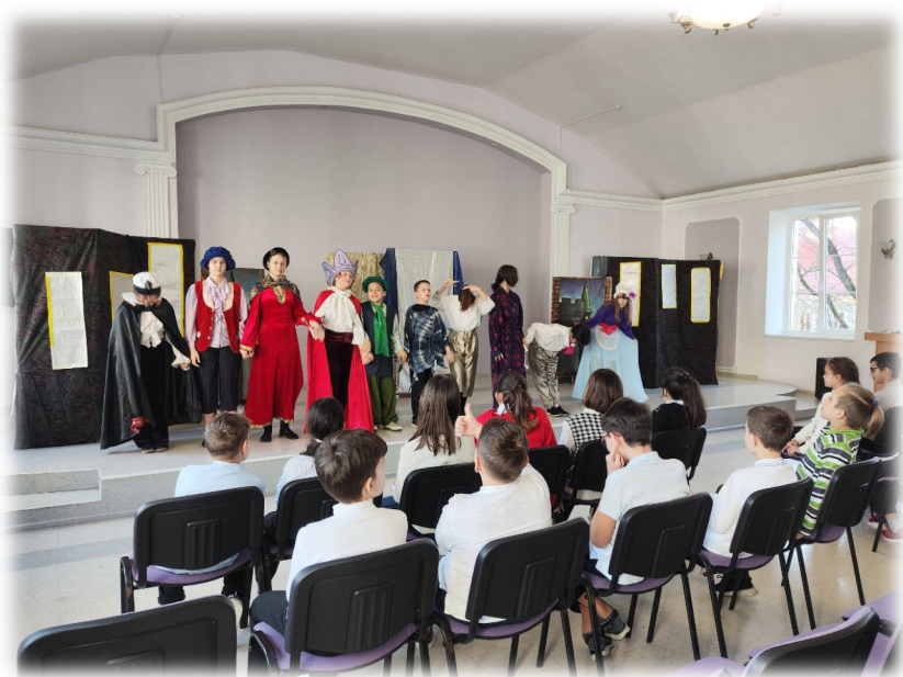
Фото на сегодняшний день

Территория проекта: сцена актового зала МАОУ СОШ №21 города Калининграда (35 м. кв.)