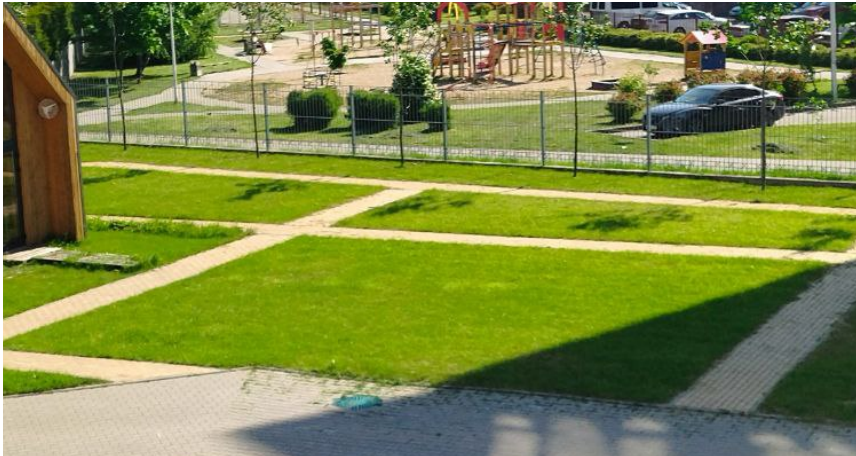
Фото на сегодняшний день