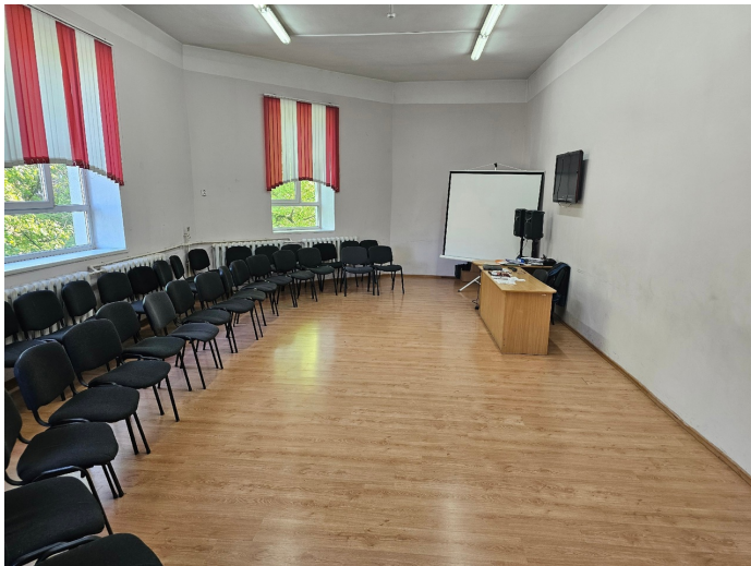
Фото на сегодняшний день