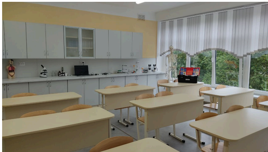
Фото на сегодняшний день

Территория проекта: Муниципальное автономное общеобразовательное учреждение города Калининграда средняя общеобразовательная школа №29, лаборатория, 18 кв.м.