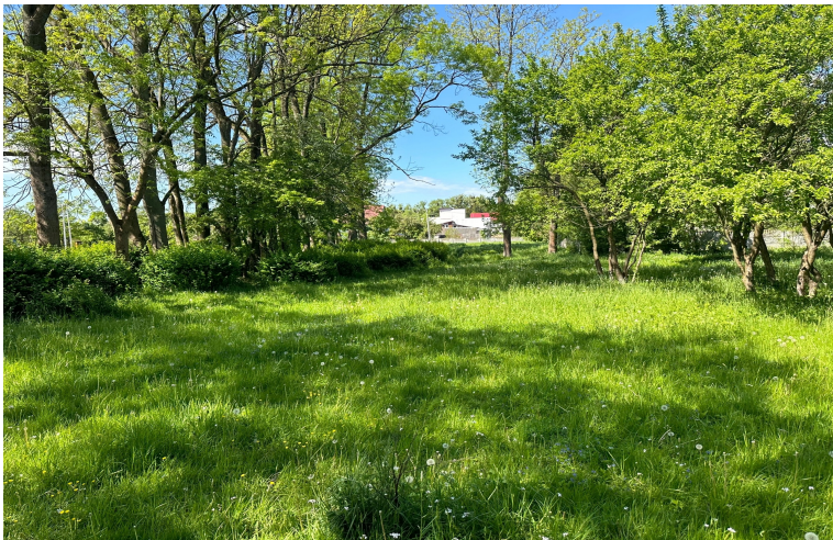
Фото на сегодняшний день

Длина 5 м, ширина 4 м. Общая площадь 20 м 2 . Будет установлено 2 игровых комплекса общей площадью 17 м 2 и скамейка (3 м 2 ).