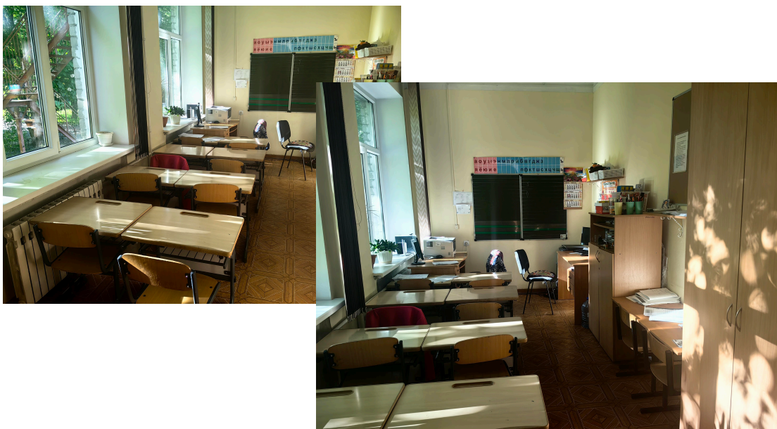
Фото на сегодняшний день