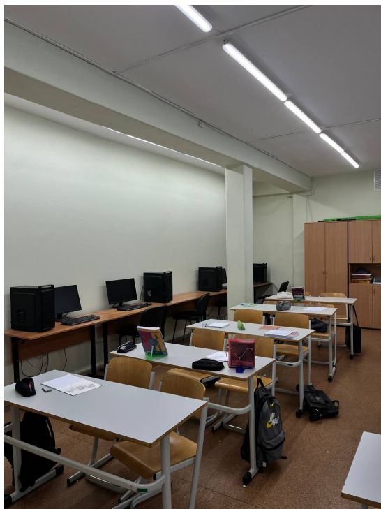
Фото на сегодняшний день

Основной целью проекта «Кабинет начальной военной подготовки» является создание пространства для подготовки к военному делу и отработать практических навыков необходимых для защиты Родины. Территория проекта: г. Калининград, ул. Комсомольская, д.4, каб. №2, площадь - 56 м 2 .